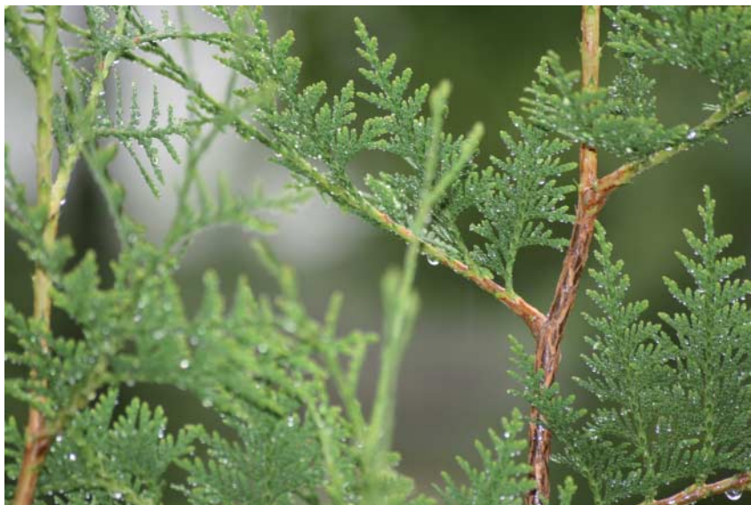
Abb. 3: Thuja wirkt hauptsächlich auf die Haut und die Urogenitalorgane.

Behandlung ab 12.3.2013: Thuja Q 3, 2 × tgl. + Artemisia-Salbe 10% (Abb. 3 und 4).