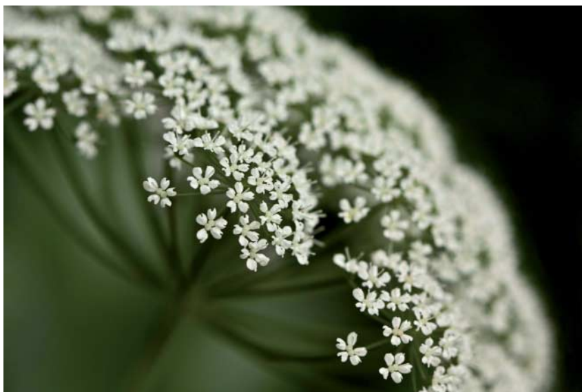
Abb. 2: Der Schierling gilt als großes Tumormittel für harte Tumoren der Brust, der Prostata, des Uterus und der Lymphknoten.

Die Kopfhaut war an unterschiedlichen Stellen schon lange verschorft. Ab Januar 2013 auffälliges Wachstum eines Tumors auf der Kopfhaut, der bis auf eine Größe von 1 cm heranwuchs, jedoch ohne Beschwerden oder Blutung. Es wurde keine Erstanamnese durchgeführt.