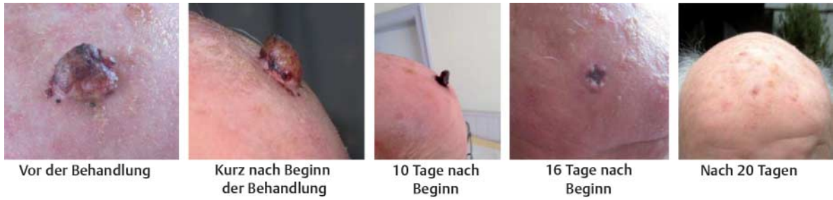
Abb. 4: Verlauf der Behandlung eines Tumors auf der Kopfhaut mit Thuja.